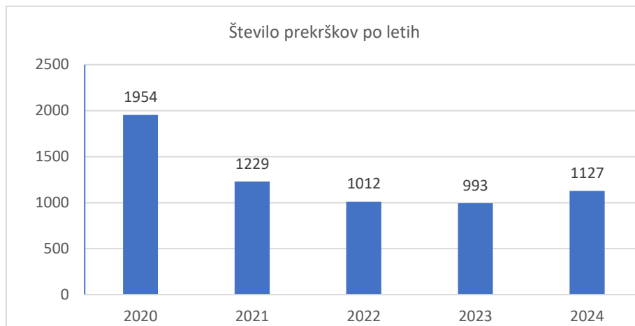
Tabela 2: gibanje števila prekrškov po letih